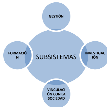
Gráfico Nro. 2: Subsistemas ITSA

Mediante Resolución No. 088-SO-10-CACES-2021, El Consejo de Aseguramiento de la Calidad de la Educación Superior con fecha 28 de julio de 2021, resolvió acreditar el Instituto Superior Técnico Americano por un período de 3 años.